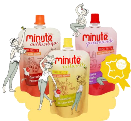
Minute naturelle – Mirabelle de Lorraine Minute gourmande – cerise, mirabelle, pomme Minute authentique – quetsche, pomme

L'AREFE est le partenaire recherche de la filière. Depuis 2015, Quentin pilote tous les essais techniques pour développer des solutions d'avenir dans la conduite des vergers.